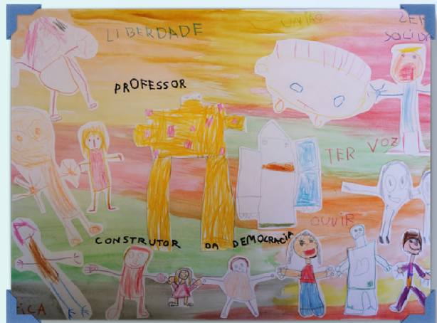
Menção Honrosa EB Manuel António Pina - V. N. Gaia