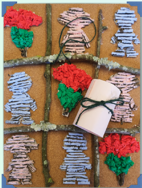
3º lugar JI- Sala do Mar - Santa Casa da Misericórdia - V. N. Cerveira